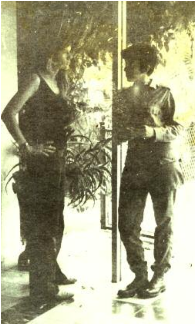
1971. Nuevo Vedado, La Habana