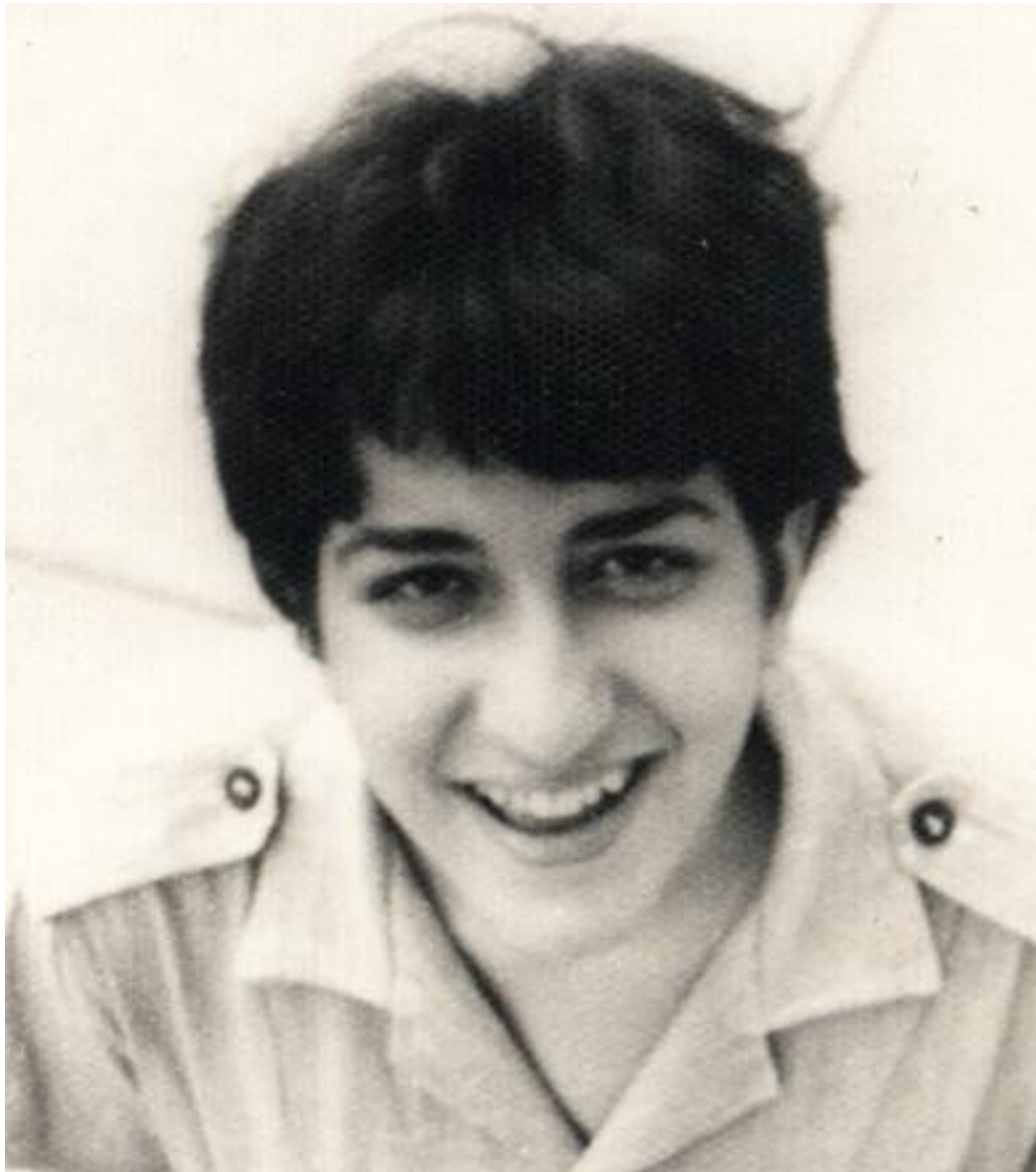
1967. La Habana