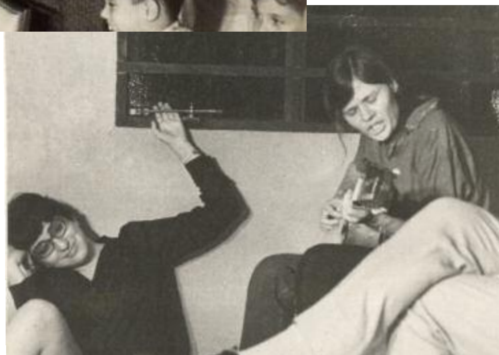
La fiesta en Santa Fe