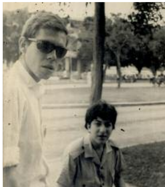
1967. Calle 8, Miramar, La Habana